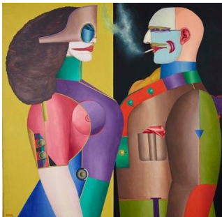
The Couple, 1971

Warmbüchenstraße 16, 30159 Hannover, T: (0511) 51 94 97 43, E-Mail: info@ahlers-proarte.com